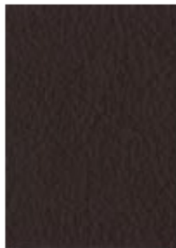
Testa di Moro 1315