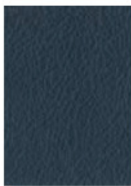
Blu Notte 1329