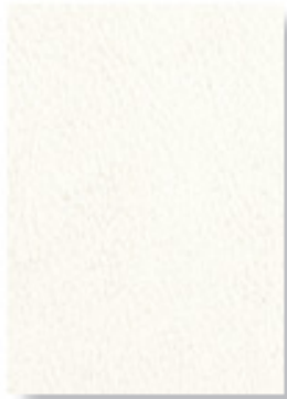
Bianco Ottico 1311

Lavare con spugna umida in acqua fredda. Wash in cold water with a damp sponge.