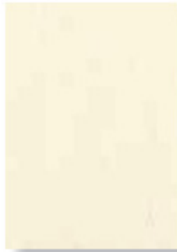
Bianco Panna 1321